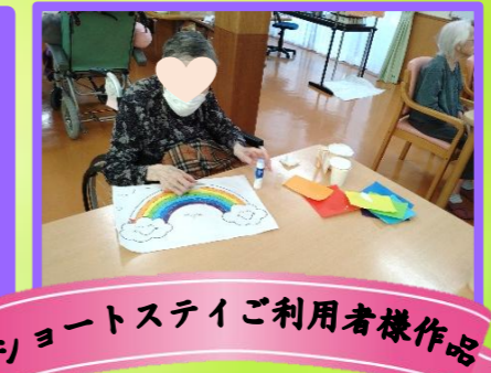
ショートステイご利用者様作品

今月の壁画制作で、お花紙と色紙を使って『紫陽花』を飾り付けてみました。これから、紫陽花の上には、綺麗な虹がかかる予定です。完成はホームページにUPしますね!