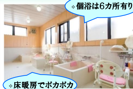
◇床暖房でポカポカ