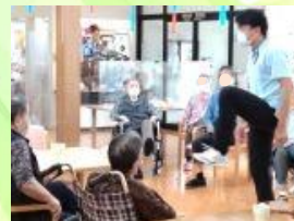
機能訓練の先生の指導の下、みんなで体操も

●ご希望があれば、理学療法士の先生が、専門の見地から作成したプログラムに沿ってリハビリを行ったり、生活の中で継続的に訓練を行います