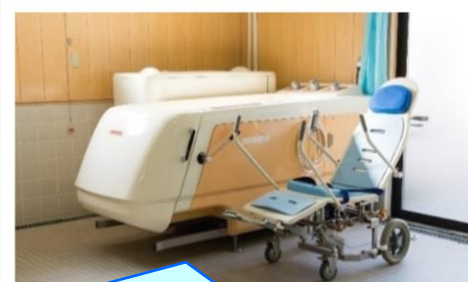
◇お身体の不自由な方、座位の取れない方でも安全な入浴が可能です

＊入浴は、活動量が低下して体を動かす機会が減りがちな高齢者にとって、要介護リスクを減らし、新陳代謝を促進するなど、沢山のメリットがあります