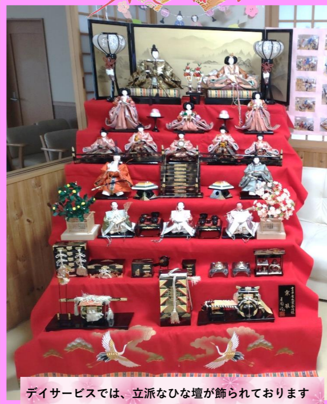
デイサービスでは、立派なひな壇が飾られております